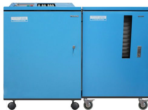
TLD AUTOMATIC READER UD-710 Y UD-730