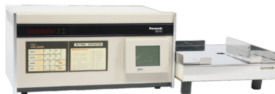
AUTOMATIC READER UD-716